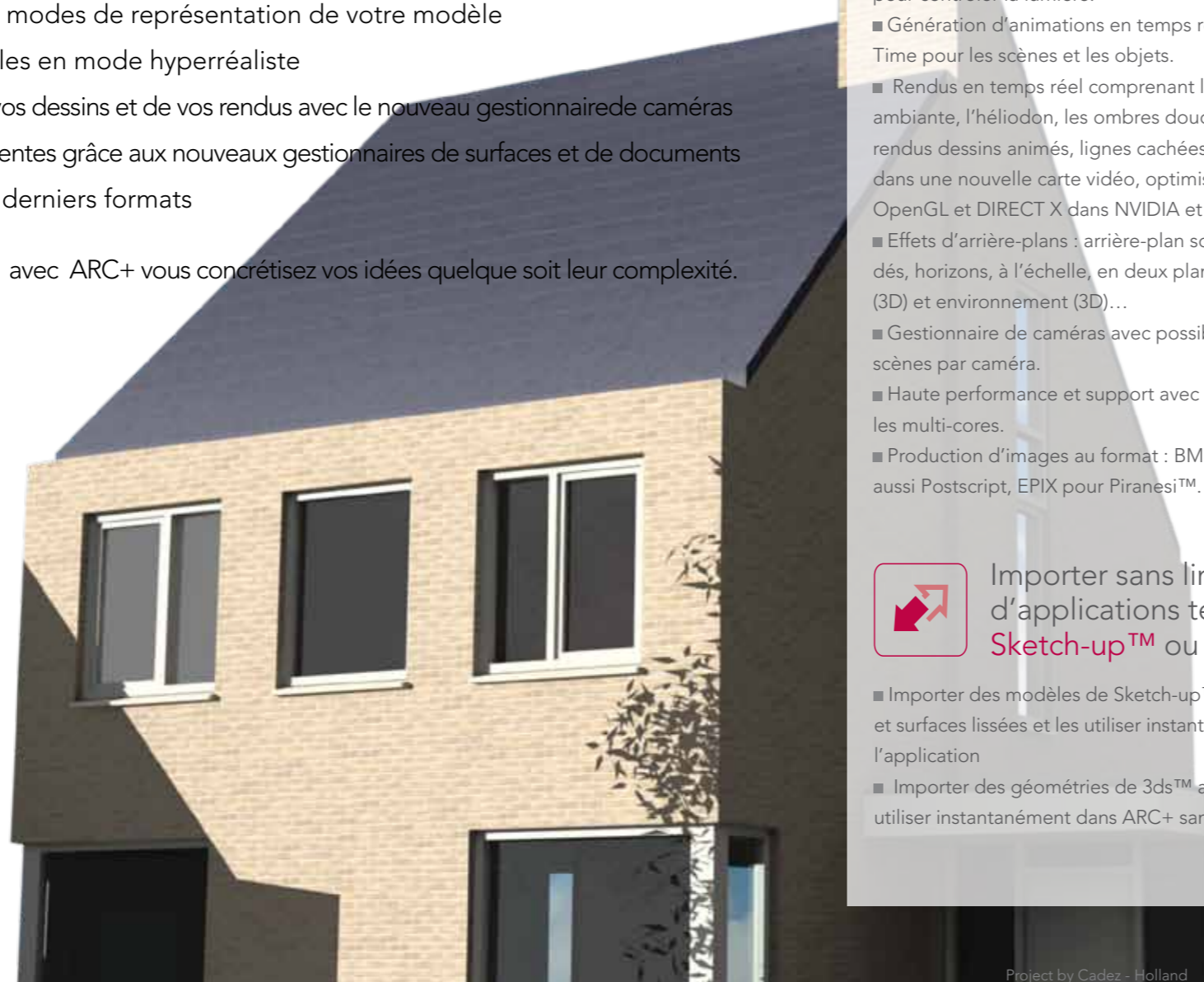
Project by Cadez - Holland