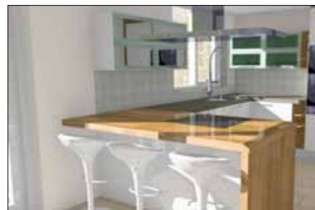
Project by Cadez - Holland

D'un simple objet, jusqu'au projet urbain, avec ARC+ vous concrétisez vos idées quelque soit leur complexité.